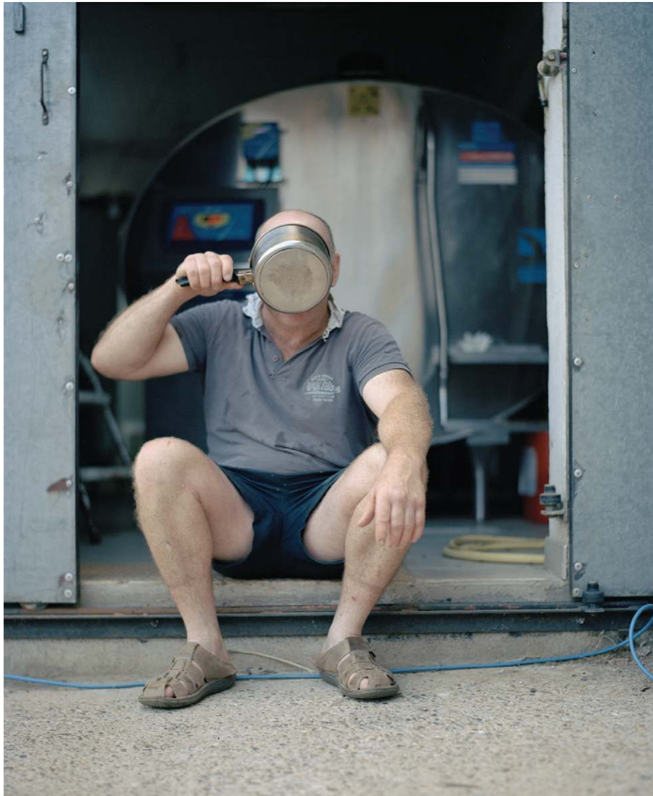
Le lait , 2020 50 × 70 cm