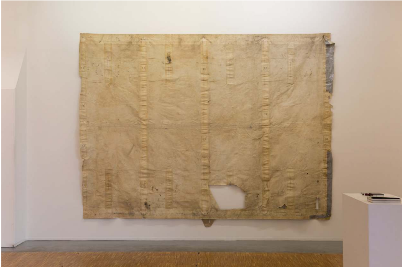
Cette bâche, mais pliée (comme un drap).