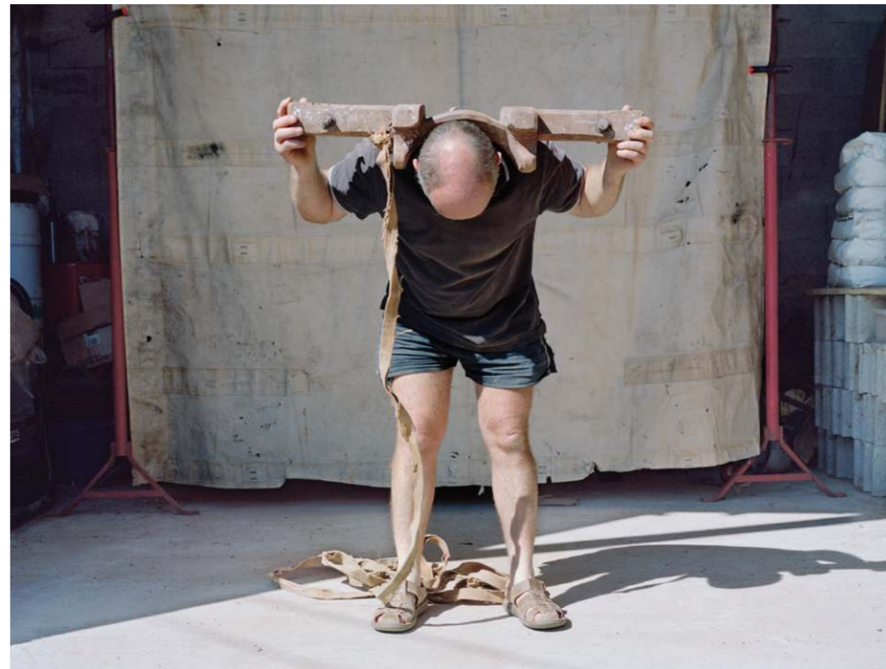
Le joug ou Les santons, 2021 deux photographies 40 × 50 cm