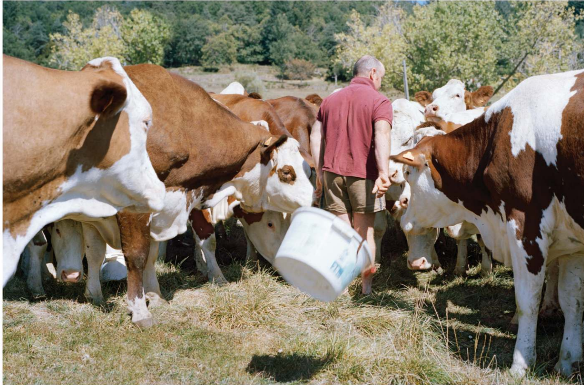
Le seau , 2019 48 × 72 cm