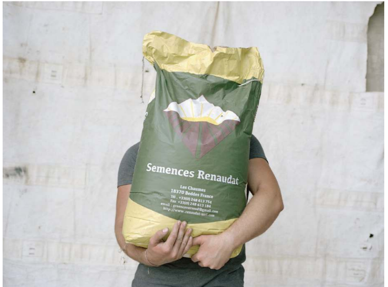
Semences (les sacs), 2019 41 × 55 cm (chaque)